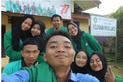
Keluarga cemara KKN Kolaborasi Pantai Lango 2022

Lanjut ga nih? Kalau ga ya tunggu part 2, bakhaha bercanda. Di part ini aku akan memperkenalkan keluarga cemara KKN Kolaborasi Pantai Lango 2022. Keluarga cemara kami terdiri dari 3 lelaki jantan dan 5 perempuan manja, hehehe.