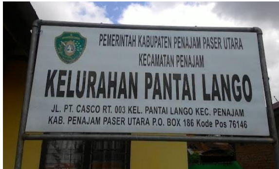
Kelurahan Pantai Lango

Sebelum lanjut, aku ceritakan dulu kali ya sedikit tentang Pantai Lango. Pantai Lango adalah salah satu kelurahan di Kecamatan Penajam, Kabupaten Penajam Paser Utara, Provinsi Kalimantan Timur, Indonesia. Sebuah wilayah pesisir yang bersebrangan dengan kota Balikpapan. Menuju Pantai Lango sangat lah jauh sekali dari jalanan utama, sekiranya menempuh waktu setengah jam dari jalan besar untuk bisa sampai ke Pantai Lango. Jalananya pun masih bebatuan dan di samping bagan jalan di penuh dengan perkebunan kelapa sawit. Masyarakat Pantai Lango lebih sering menggunakan transportasi air, ya alasanya biar lebih cepat. Wilayah Pantai lango sangatlah kecil, memiliki 3 wilayah yaitu Hilir, Atas dan Hulu. Lingkungan Pantai Lango sangat lah memprihatinkan, banyak sekali sampah yang berserakan, karena kurang pedulinya masyarakat sekitar dengan sampah dan kebersihan atau mungkin adanya sampah kiriman yang larut dari laut. Jumlah penduduk yang berada di Pantai Lango pun kurang lebih ada 400 kepala, dan ada 6 RT disana. Suku yang paling dominan di sana yaitu Bugis dan Bajau. Soal kepercayaan mayoritas masyarakat Pantai Lango menganut agama Islam. Pekerjaan