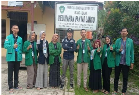
Foto Bersama pak lurah